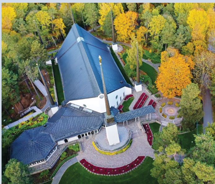
Stockholms tempel med himmelskt perspektiv

Vi kände det gott att kunna vara i templet dessa tolv veckor och bli mer hemmastadda än tidigare. Vi kom närmare varandra och upptäckte hur väl vi som par kunde samarbeta. Vi tog oss mer tid än vanligt att läsa i bland annat Nya testamentet, och allt sammantaget gav en myckenhet av andlig näring och stärkte vårt förhållande till